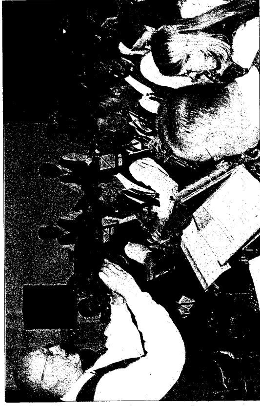
Beste Blasmusik bot die Trachtenkapelle Oberaich aus der Steiermark.